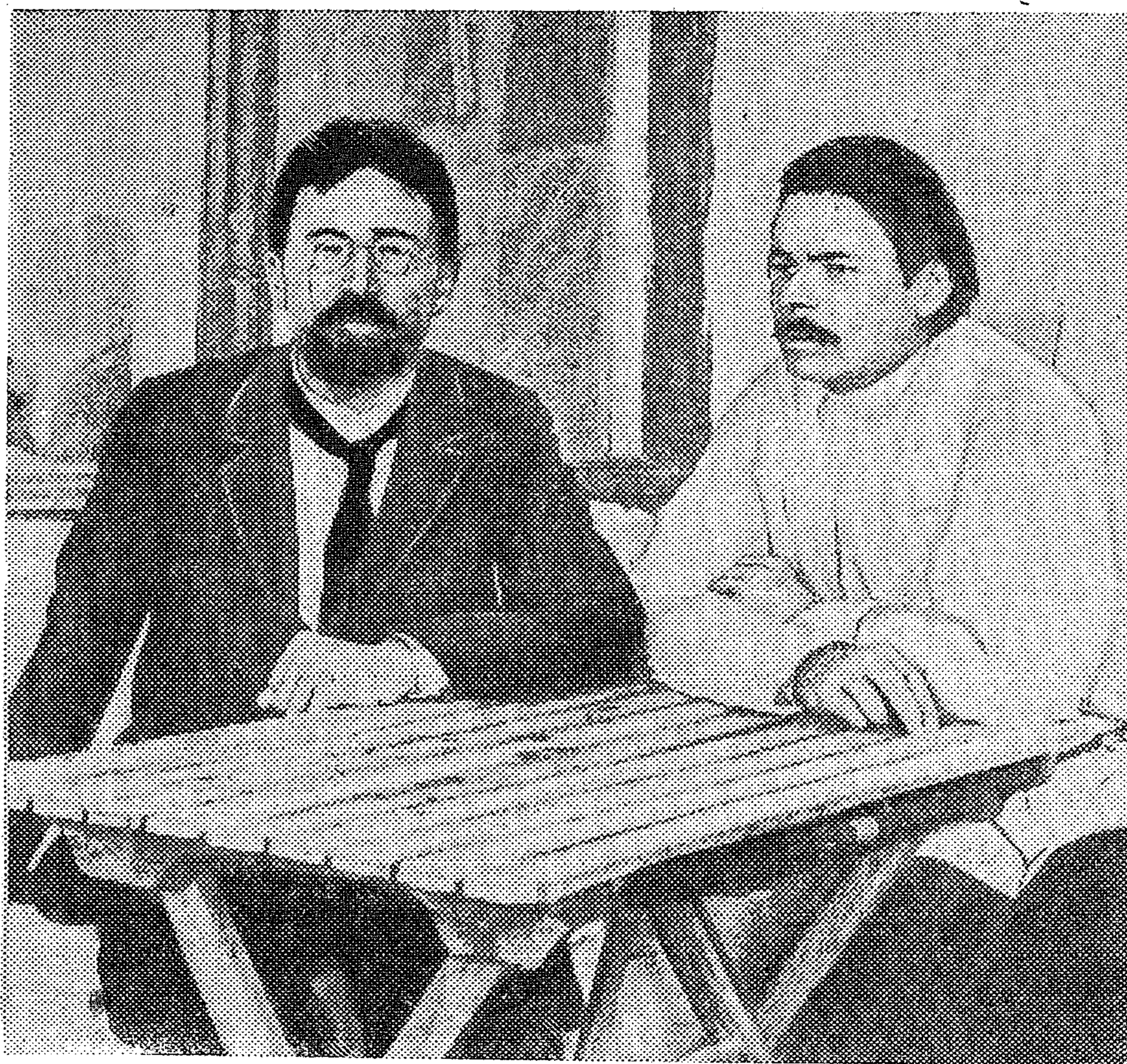
А. Чехов и М. Горький в Ялте в 1901 г. (Дом-музей им. Чехова в Ялте).