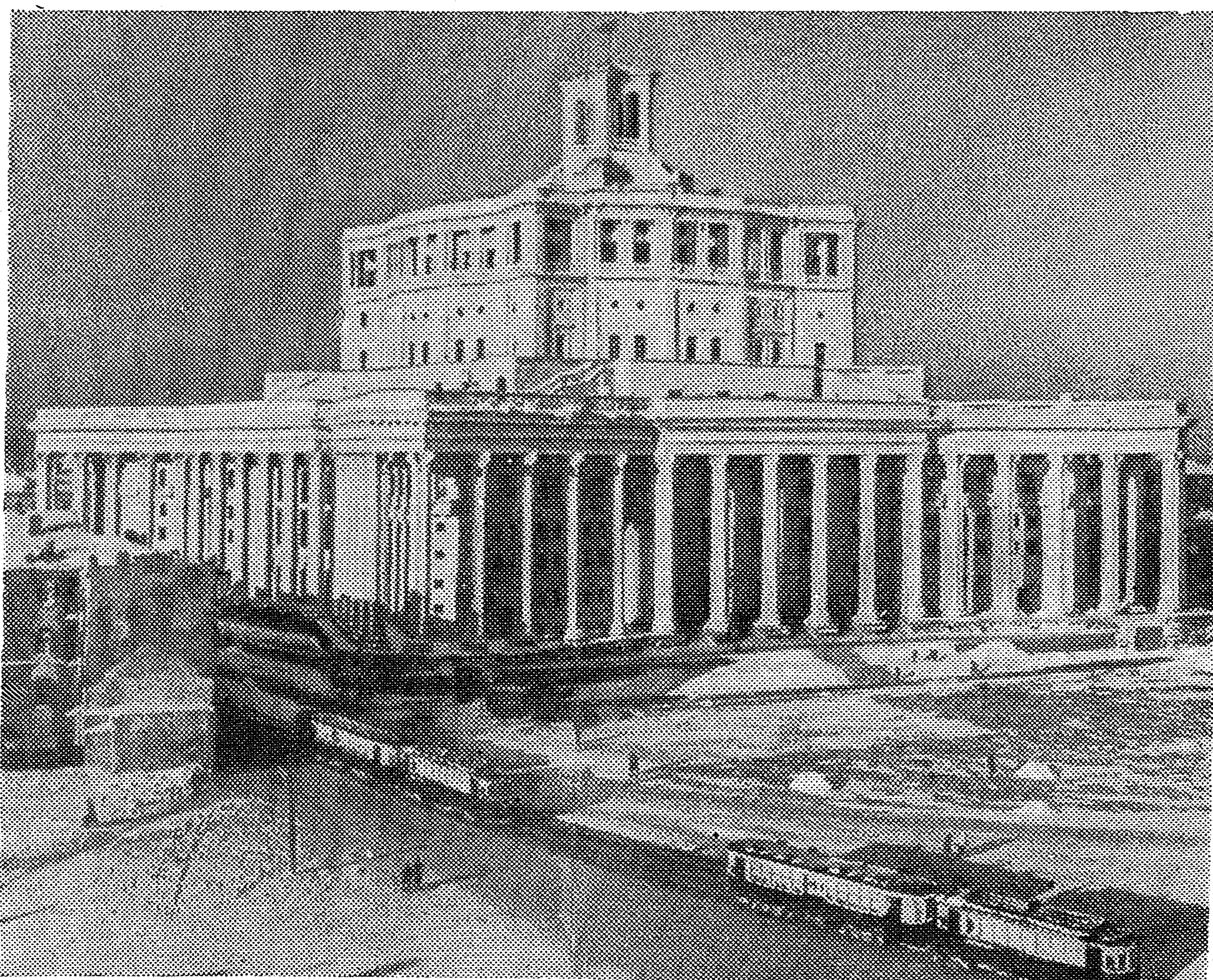
Новый театр Красной Армии.