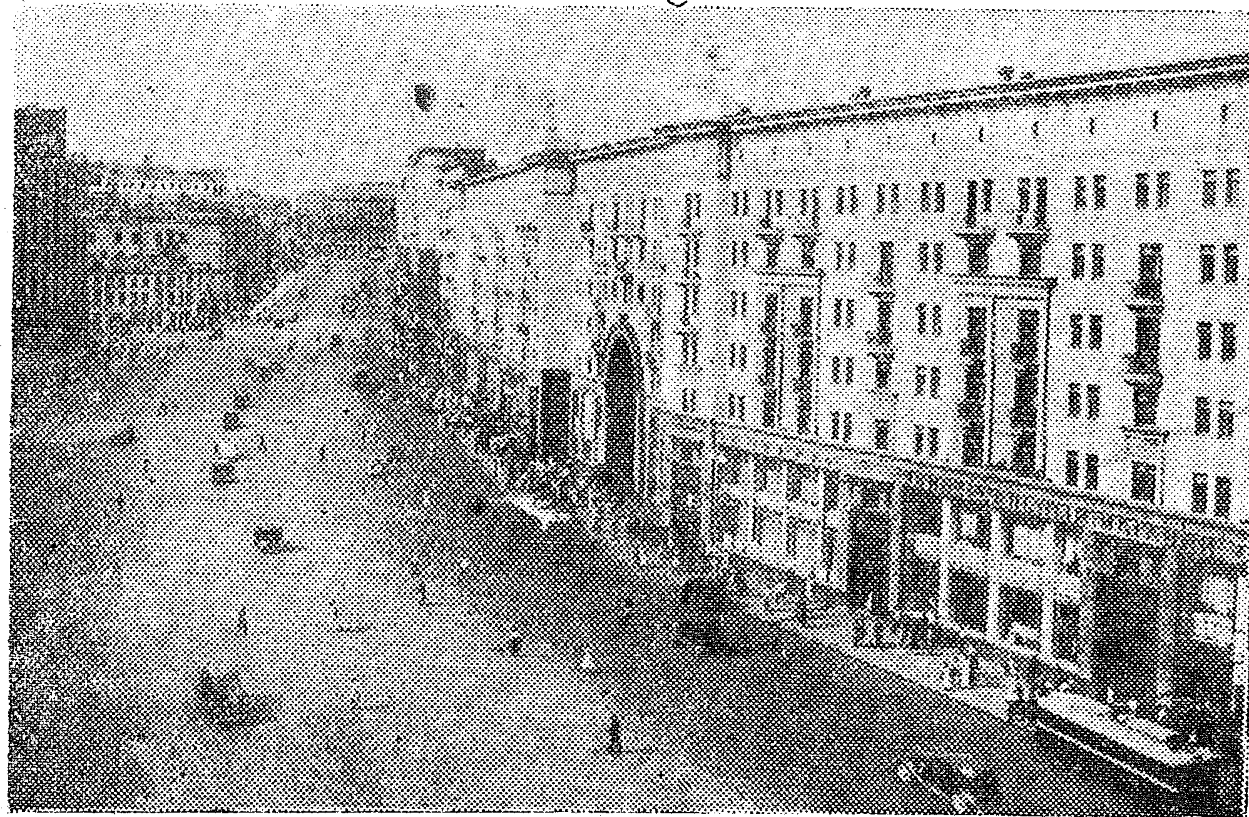
Москва, улица Горького.

Хорошо воспользовавшись пробирку, студент передает ее для наполнения преподавателем, сам же становится за дверью ассистентской. Убедившись, что наполнение пробирки закончено, студент входит в ассистентскую и заносит в свой лабораторный журнал формулы, написанные на оклянках с колеблющимися менисками. Этот метод дает, примерно, такие же конечные результаты, что и предыдущий.