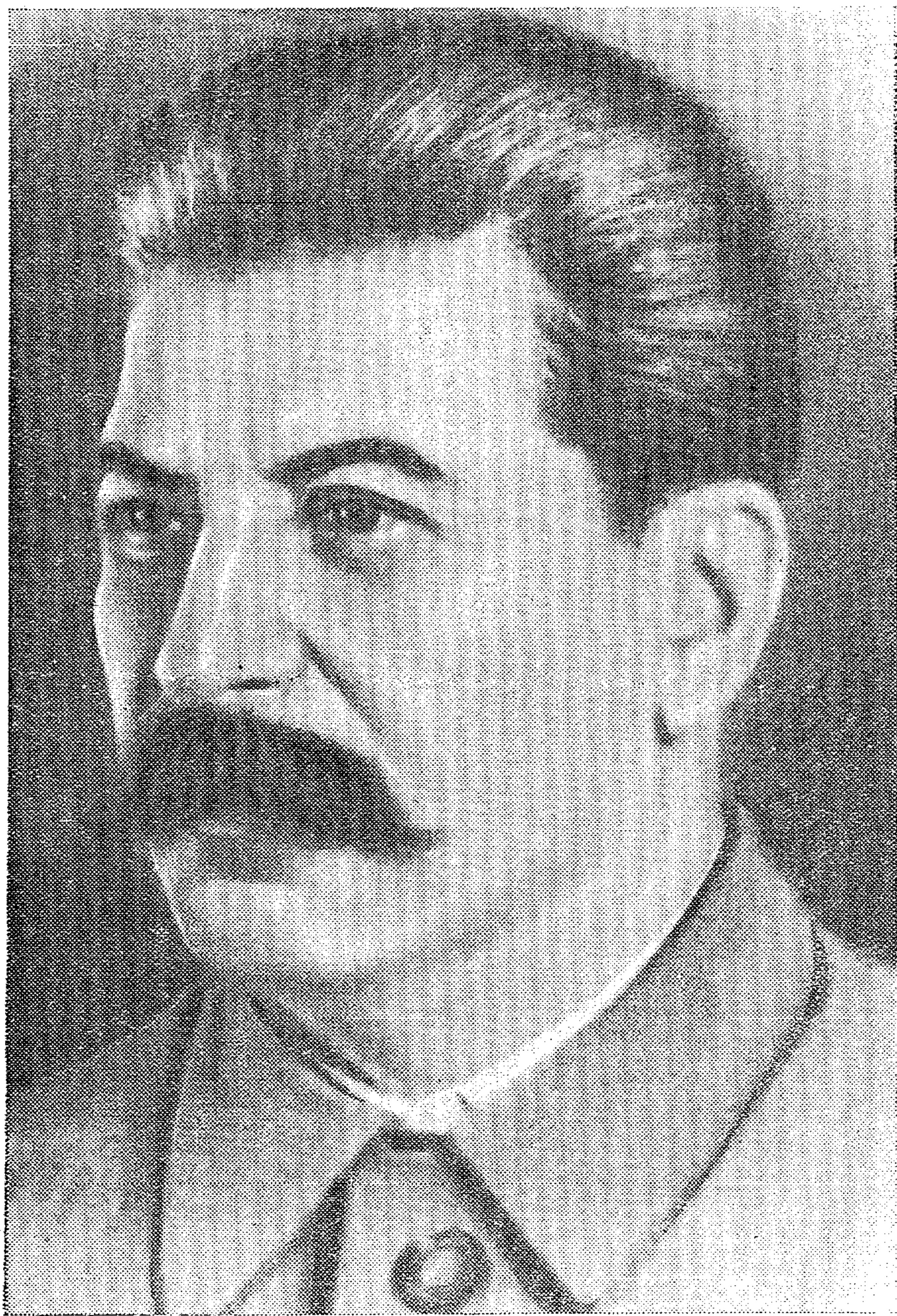
Первый кандидат советского народа — Иосиф Виссарионович СТАЛИН

Да здравствует великий и мудрый вождем народов товарищ Сталин!