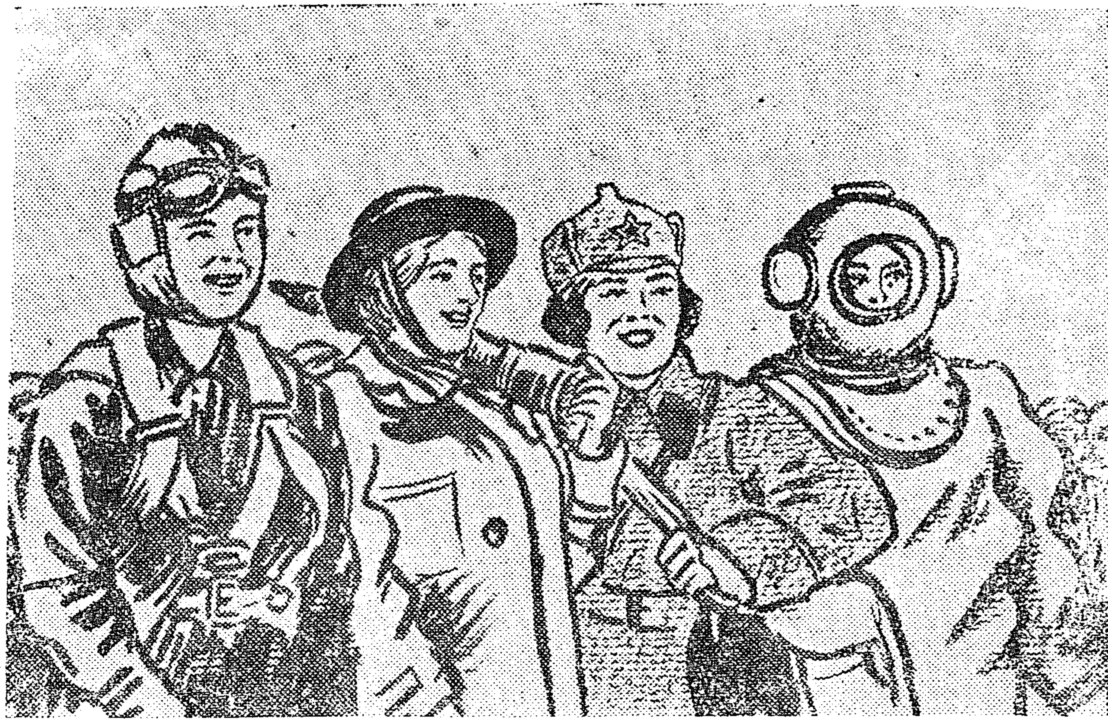
Красавицы, миру на диво, Румяны, стройны, высоки,