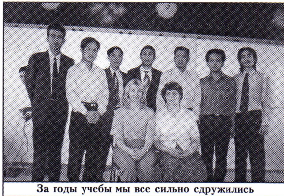
За годы учебы мы все сильно сдружились