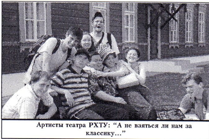
Артисты театра РХТУ: "А не взяты ли нам за классику..."

Лев Толстой. Писатель очень любил ра- ботать в тишине, поэтому в каждой ком- нате было все необходимое для работы, чтобы он мог в любое время уединиться и спокойно записать свои мысли. Его биб- лиотека насчитывает более 22000 назва- ний книг, среди которых сотни томов с по- метками самого Толстого. В знаменитой комнате под сводами, известной по карти- не И.Е.Репина, Л.Н.Толстой работал над романом "Война и мир". Наверху - каби- нет последних лет писателя. Тут он со- здал ряд своих произведений, в том числе "После бала", "Не могу молчать", "Ходы- нка" и много других. За круглым столом в уютном уголке зала по вечерам собира- лись семья и гости, велись душевные бе- седы. Читали, занимались рукоделием. А в гостях у Толстого бывали многие рус- ские и зарубежные деятели искусства и