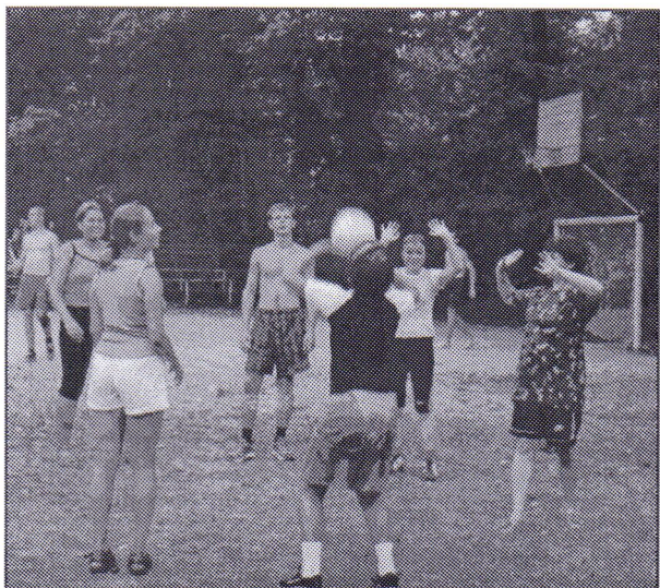
В кругу друзей - жить веселей

-хотите восстановить жизненный тонус и насладиться природой - в вашем распоряжении вся терри-