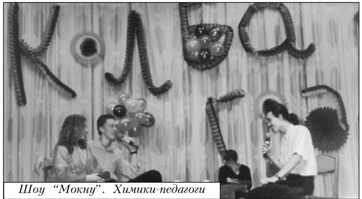
Шоу "Мокну". Химики-педагоги

курсника. Многие ребята из команды уже в третий, четвертый раз выходят на эту сцену вместе с новичками. На "Колбе года" мы выступали через несколько дней после участия в Малом кубке Московской Студенческой лиги КВН, но поверьте, зал с нашими первокурсниками - самый благодарный, любимый и теплый.