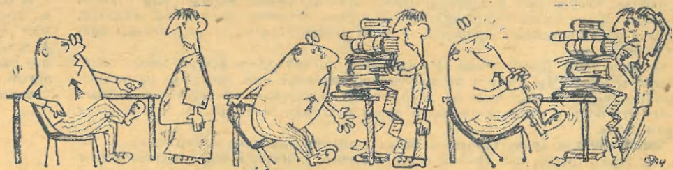
Книжку на стол...