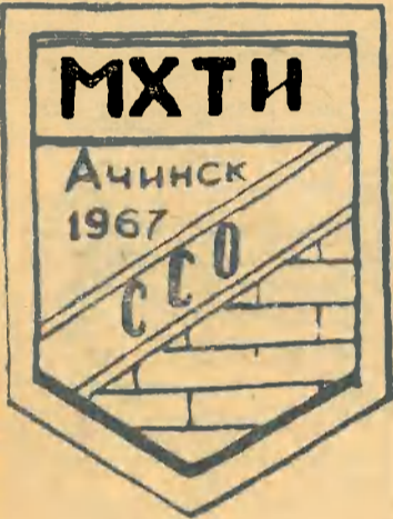
Рисунок студента КРЫЛОВА (Ф-36).

Эмблемы, представленные на конкурс для отъезжающих на стройки.