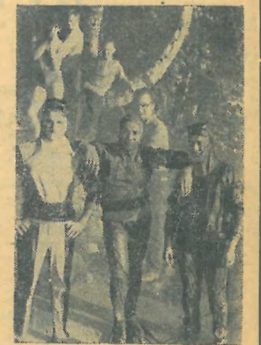
На снимке: члены клуба «Дельфин».